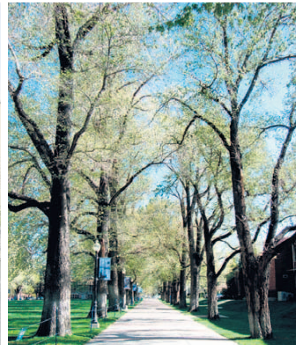
Idazleak urtebete eman zuten Renon (Nevadan) eta hiriko unibertsitatea den UNR-en klaseak eskaini zituen.