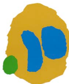
Baina Aita eta Ama Urdinek esan zuten: «Zu ez zara gure Urdin Txiki, berdea zara eta».