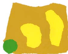
Eta Aita eta Ama Horiek esan zuten: «Zu ez zara gure Hori Txiki, berdea zara eta».